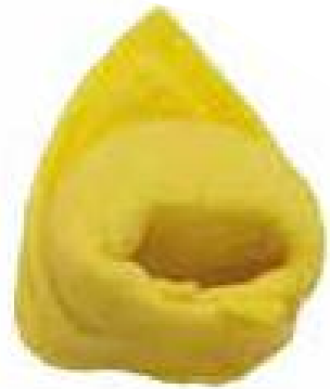
TB - Tortellino 2 gr

UNA MACCHINA DI PICCOLE DIMENSIONI SOLAMENTE 700 X 800 X H 800 CON UN PESO DI 60 KG.