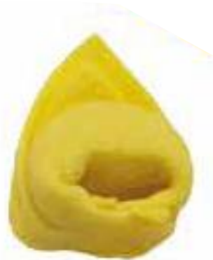
TC - Tortellino 4 gr